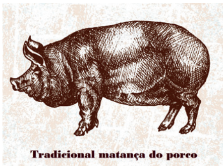
Tradicional matança do porco