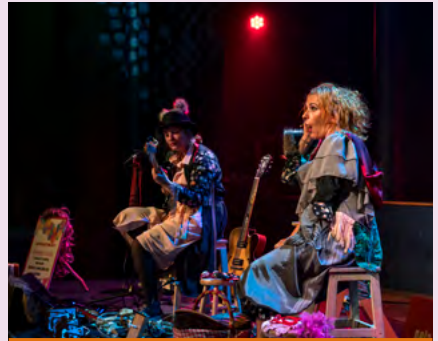
BIBLIOTECA MUNICIPAL DE SEVER DO VOUGA

Promotor Município de Anadia Público-alvo Crianças dos 5 aos 12 anos (acompanhadas de um adulto)