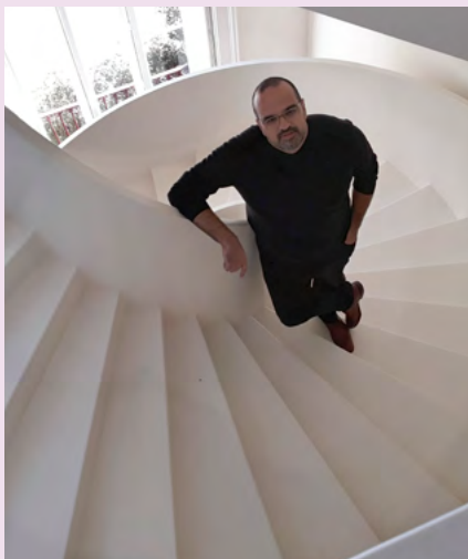
BIBLIOTECA MUNICIPAL DE OVAR

Horário(s) 14h30-16h30 Promotor Município de Sever do Vouga Público-alvo Pais de Adolescentes