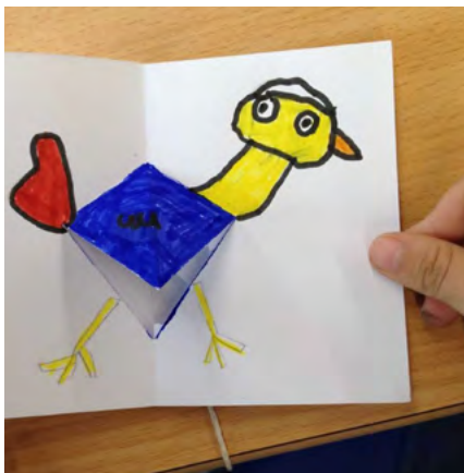
BIBLIOTECA MUNICIPAL DE ALBERGARIA-A-VELHA