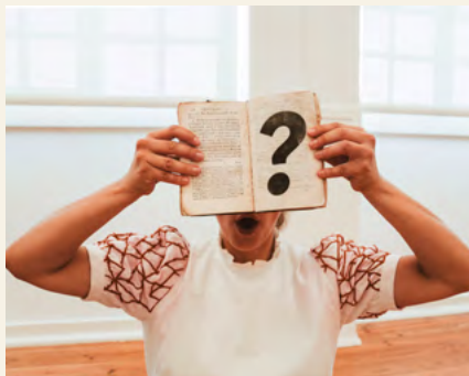
BIBLIOTECA MUNICIPAL MANUEL ALEGRE