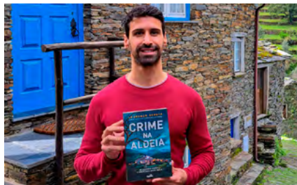
BIBLIOTECA MUNICIPAL DE ÍLHAVO

Horário(s) Até às 18h00 Promotor Município de Albergaria-a-Velha Público-alvo Comunidade em Geral