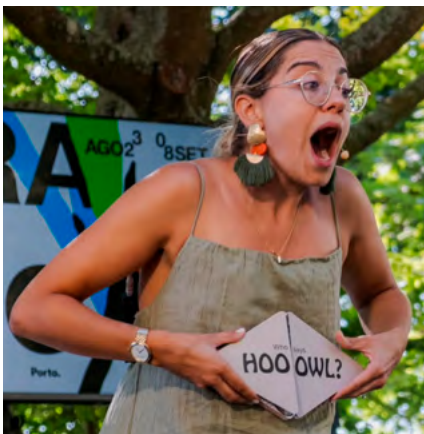
BIBLIOTECA MUNICIPAL DE OLIVEIRA DO BAIRRO