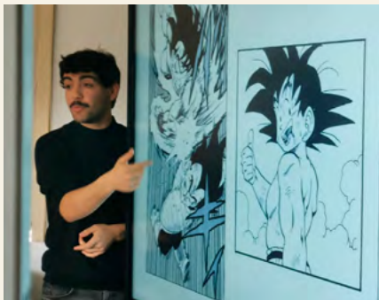
BIBLIOTECA MUNICIPAL DE ÍLHAVO