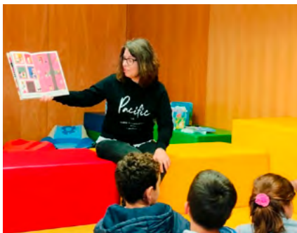
BIBLIOTECA MUNICIPAL DE ANADIA

+info: http://bm.cm-olb.pt | bmolb@cm-olb.pt | Tel. 234 732 117