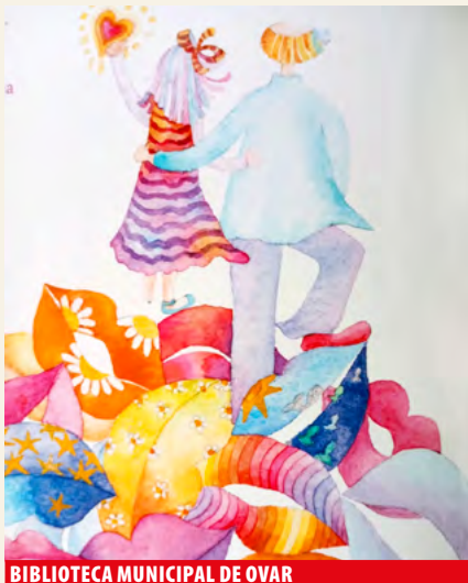
BIBLIOTECA MUNICIPAL DE OVAR