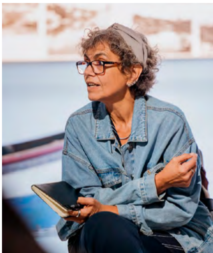
BIBLIOTECA MUNICIPAL MANUEL ALEGRE

Criança maior de 4 anos + 1 acompanhante