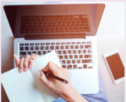
BIBLIOTECA MUNICIPAL DE ESTARREJA

Com uma programação especial e uma oferta ainda mais diversificada de livros, esta edição pretende cativar leitores de todas as idades.