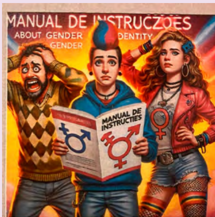
BIBLIOTECA MUNICIPAL DE SEVER DO VOUGA