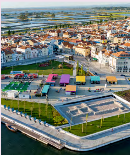
BIBLIOTECA MUNICIPAL DE AVEIRO